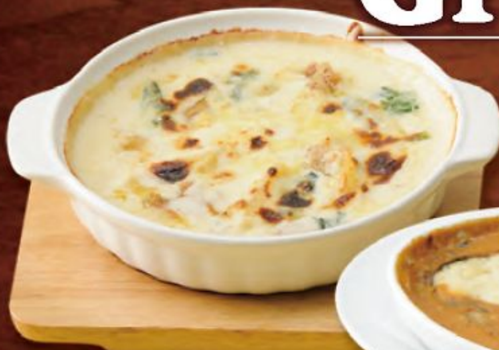
チキンとほうれん草

マカロニたっぷりのグラタンと、ラザーニェとソースが折り重なるラザニア。どちらもグルービーで作るソースが決め手!! アツアツをお召し上がりください。