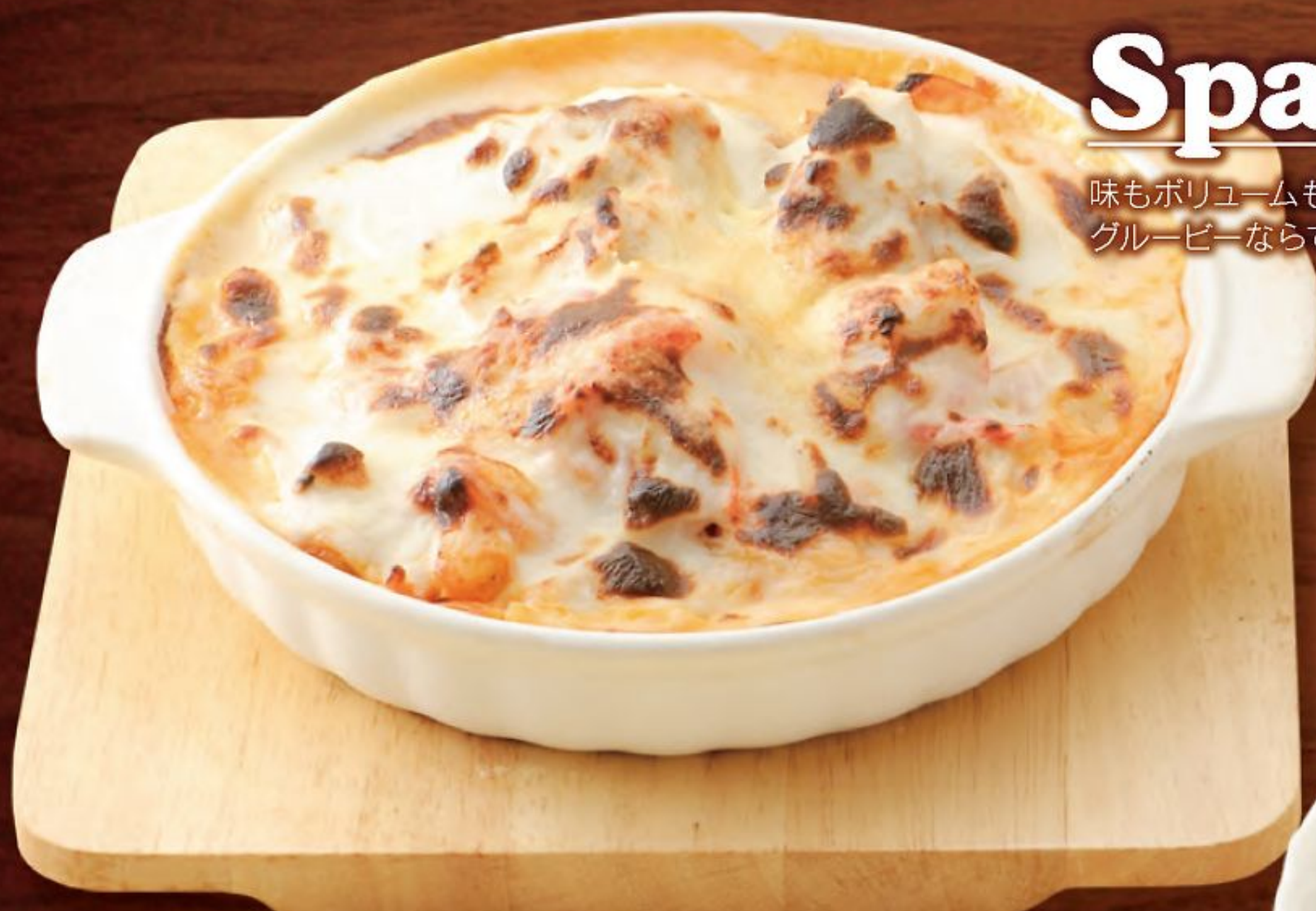
海賊スパゲッティ (トマトソース味のホワイトソースかけ)