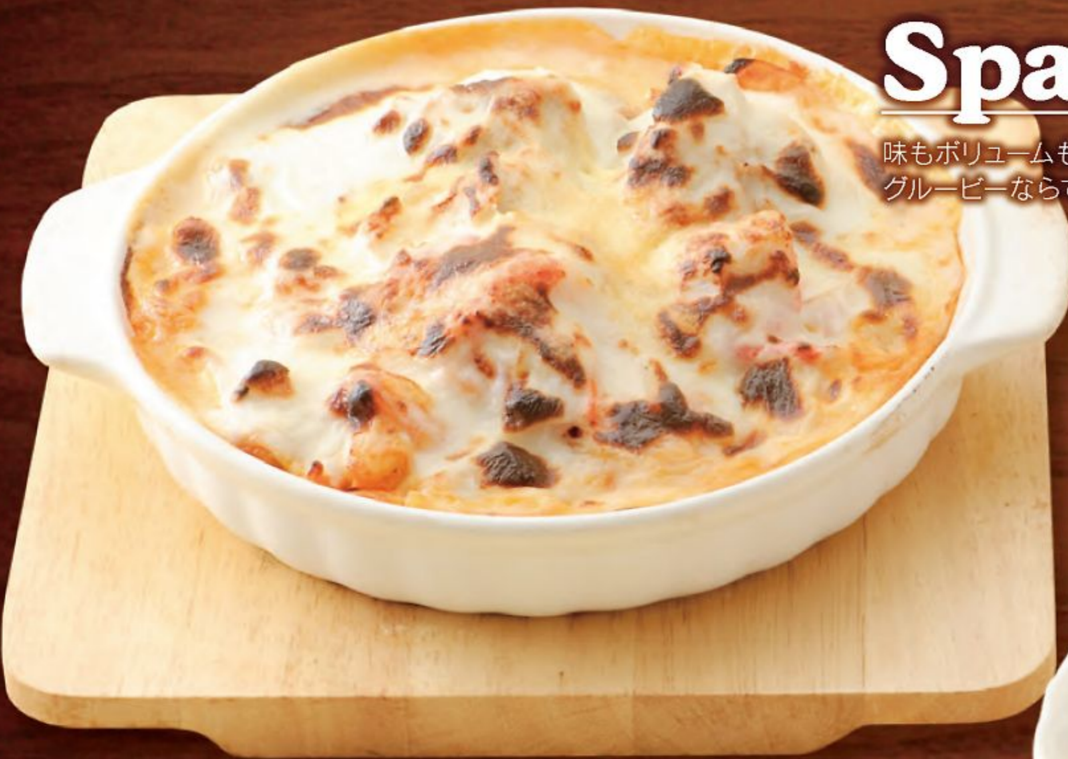
海賊スパゲッティ (トマトソース味のホワイトソースかけ)