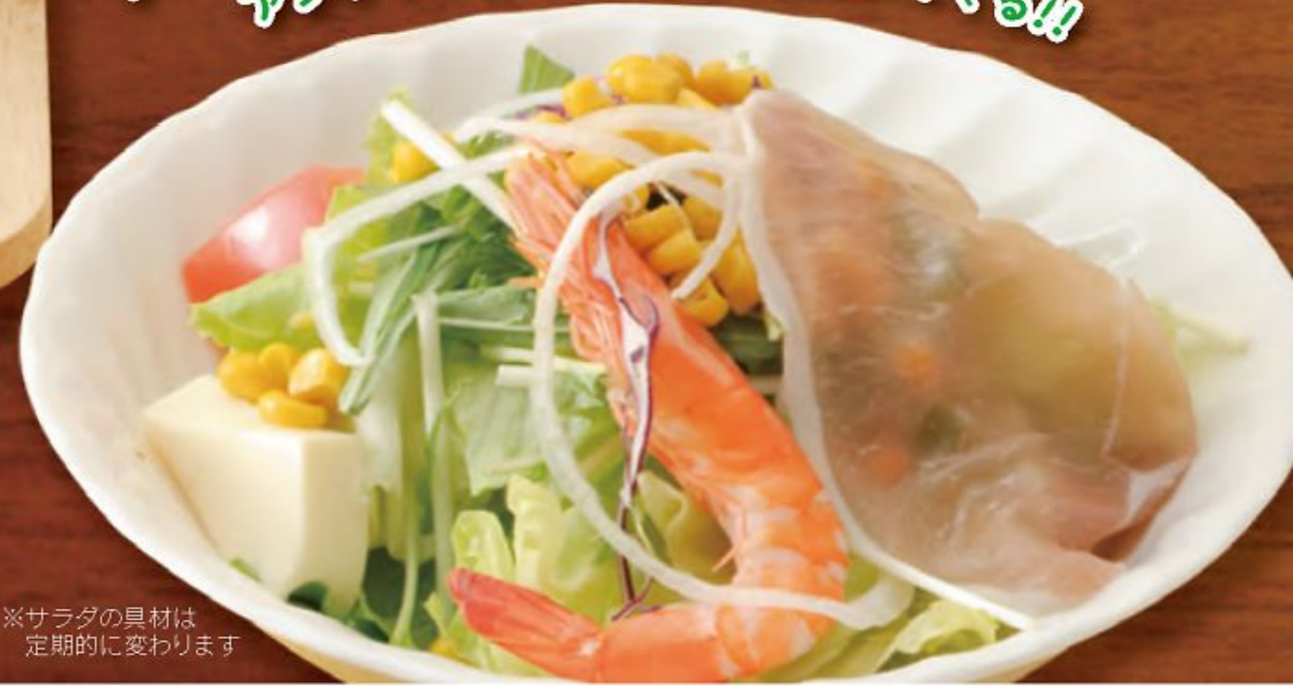
※サラダの具材は 定期的に変ります