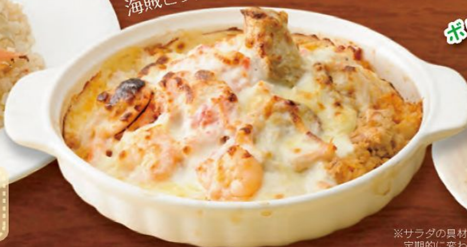
ボリュームたっぷり アンティサラダ付き!