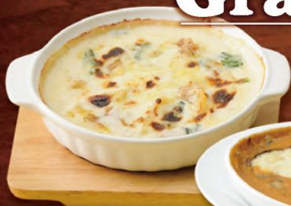
チキンとほうれん草

マカロニたっぷりのグラタンと、ラザーニェとソースが折り重なるラザニア。どちらもグルービーで作るソースが決め手!! アツアツをお召し上がりください。