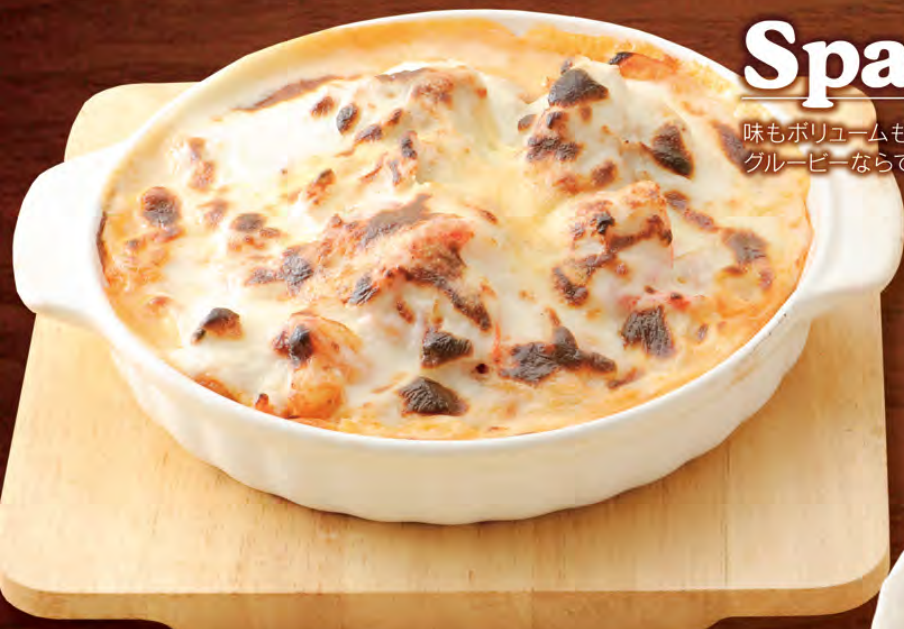
海賊スパゲッティ (トマトソース味のホワイトソースかけ)