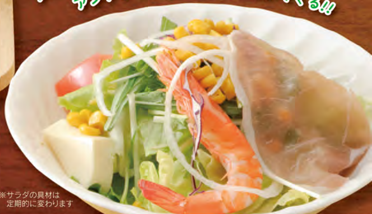
※サラダの具材は 定期的に変わります